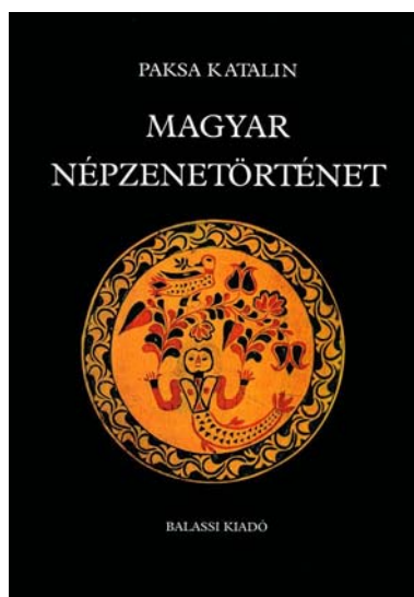
38. ábra. Paksá Katalin könyvének borítója 43