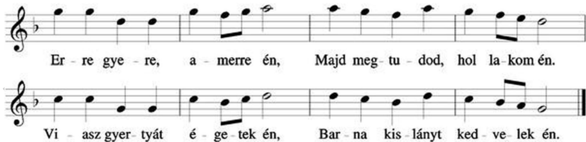
11. ábra. Ti-pienhangos lá-pentaton dallam 15