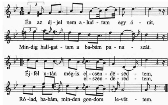
35. ábra. Gyimesi lassú magyaros táncdallam 39

Kodály Zoltán: A magyar népzene című könyvének Vargyas Lajos által szerkesztett példatárában az alábbi népdalok képviselik ezt a stílusréteget: