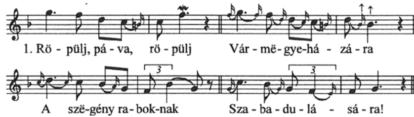
10. ábra. A "páva dallamcsalád" névadó dallama 14

Kodály Zoltán: A magyar népzene című könyvének Vargyas Lajos által szerkesztett példatárában az alábbi népdalok képviselik ezt a stílusréteget: