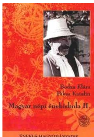
40. ábra. A Magyar népi énekiskola II. kötetének borítója 46