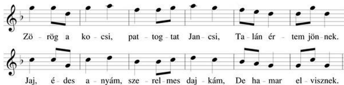
12. ábra. 6 soros, motívikus építkezésű, pienhangos, lakodalmás táncdallam 16

Kodály Zoltán: A magyar népzene című könyvének Vargyas Lajos által szerkesztett példatárában az alábbi népdalok képviselik ezt a stílusréteget: