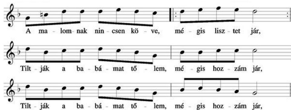
28. ábra. Székelyföldi táncdallam 32

Kodály Zoltán: A magyar népzene című könyvének Vargyas Lajos által szerkesztett példatárában az alábbi népdalok képviselik ezt a stílusréteget: