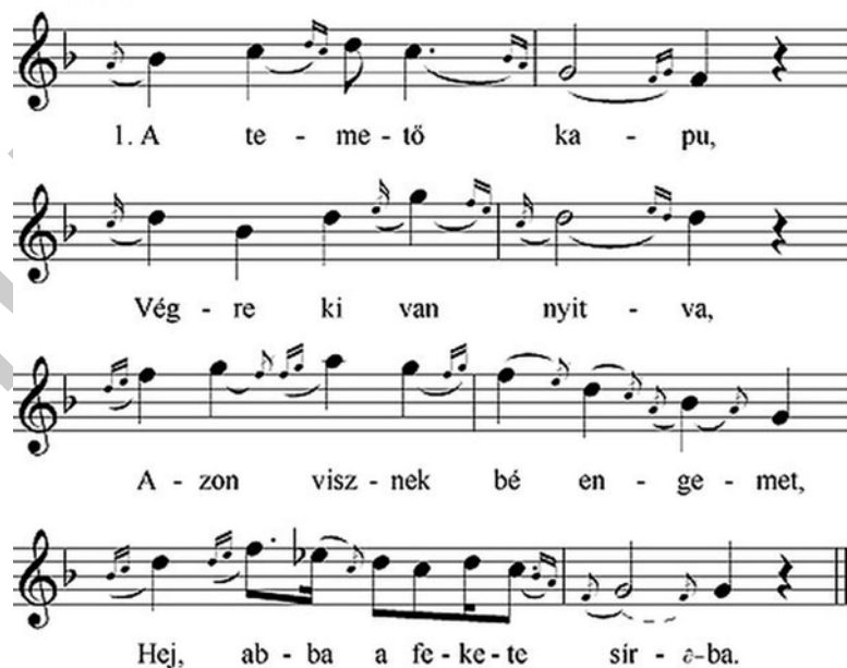
36. ábra. Gazdagon díszített kalotaszegi dallam 40