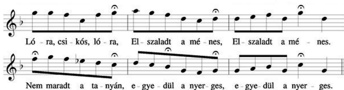
13. ábra. Parlando előadásmódú pásztordal 17

Kodály Zoltán: A magyar népzene című könyvének Vargyas Lajos által szerkesztett példatárában az alábbi népdalok képviselik ezt a stílusréteget: