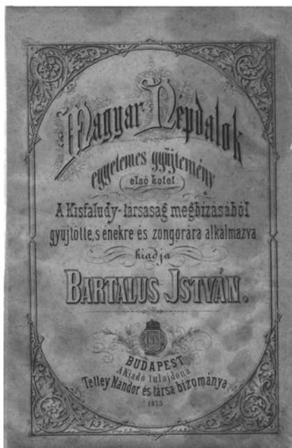
1. ábra. Bartalus István gyűjteményének címlapja 2