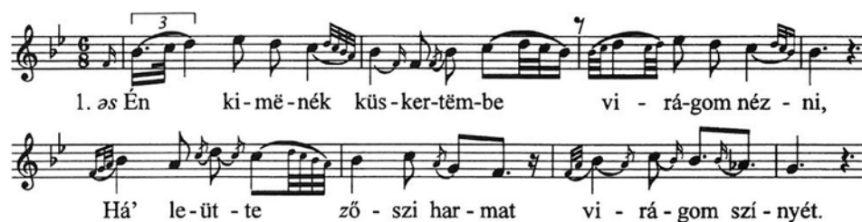
27. ábra. Gazdagon díszített moldvai népdal 31

Kodály Zoltán: A magyar népzene című könyvének Vargyas Lajos által szerkesztett példatárában az alábbi népdal képviselik ezt a stílusréteget: