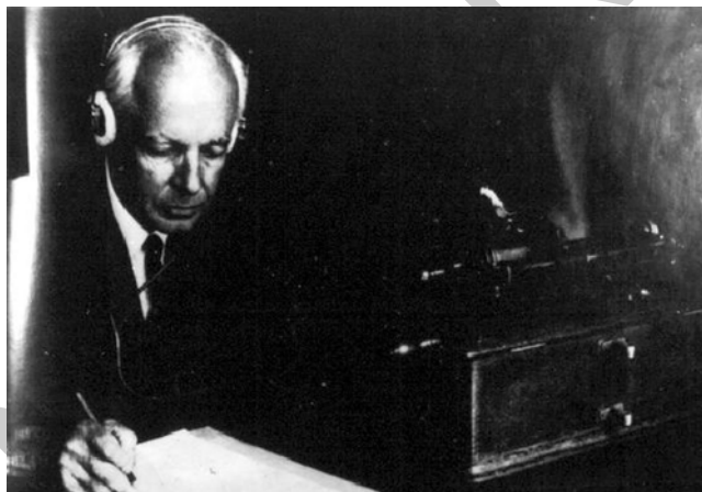
2. ábra. Bartók Béla lejegyzés közben 4

Bizonyos módosításokkal erre a felosztásra épült későbbi (1934–40 között kidolgozott) összkiadási javaslata is, mely a II. világháborúig összegyűlt mintegy 13 500 dallamra vonatkozott. A dallamok csoportosításának fő szempontjává a magyar vagy idegen eredet, ezen belül a történelmi–stiláris fejlődés ábrázolása lett.