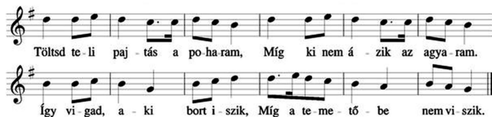
32. ábra. Sorisméltó ivónóta 36

Kodály Zoltán: A magyar népzene című könyvének Vargyas Lajos által szerkesztett példatárában az alábbi népdalok képviselik ezt a stílusréteget: