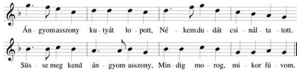
17. ábra. "Dudanóta" 21

Kodály Zoltán: A magyar népzene című könyvének Vargyas Lajos által szerkesztett példatárában az alábbi népdalok képviselik ezt a stílusréteget: