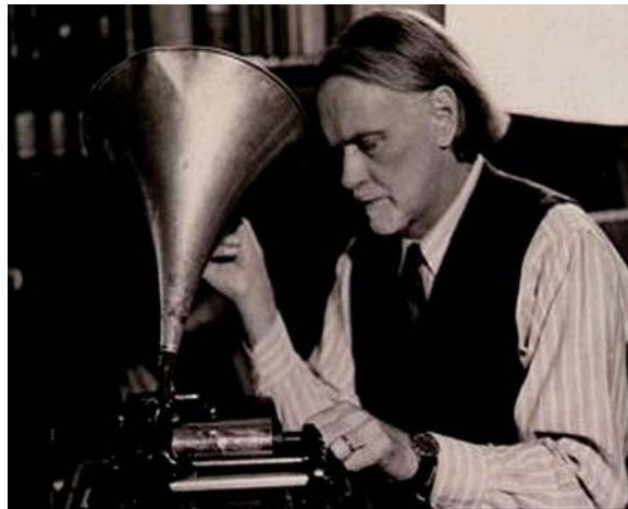
3. ábra. Kodály Zoltán munka közben 6

Kodály Zoltán az 1937-ben megjelent A magyar népzene című tanulmányában a népzene stílusrétegeit már történeti-összehasonlító, azaz filológiai alapon tárgyalta. Kidolgozását azonban már nem vállalta magára, ezért mechanikus rendben tárolt támlapjainak rendezését átengedte tanítványainak. A mintegy 28 000 támlapból álló gyűjtemény a Bartók Rendhez hasonlóan a Zenetudományi Intézet népzenei gyűjteményének zárt egységként kezelt része.